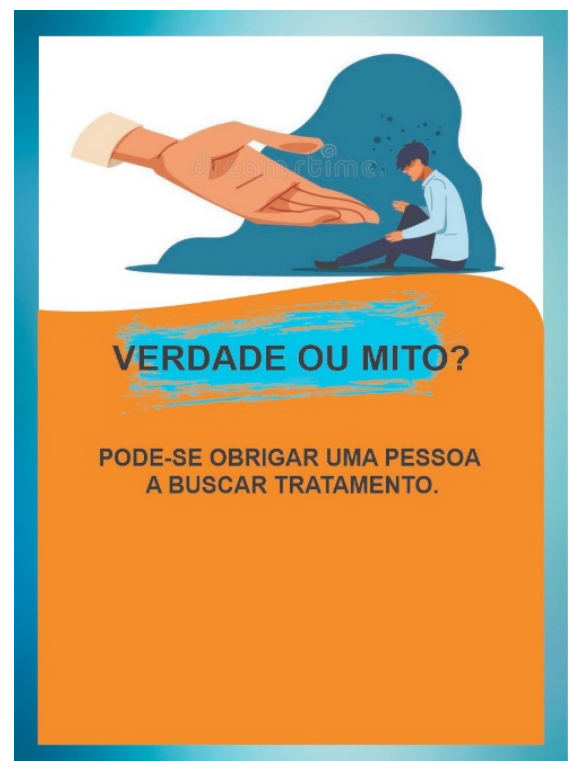
Figura 03 – Carta Verdade ou Mito do Jogo SuperAção. Sobral/Ceará-Brasil, 2021

O dado será lançado por cada participante, e antes de percorrer o total de casas no tabuleiro correspondente ao número do dado, terá que responder às perguntas contidas nas cartas do jogo. A maioria das cartas contém perguntas do tipo “Verdade ou Mito”, apresentadas na figura 03.