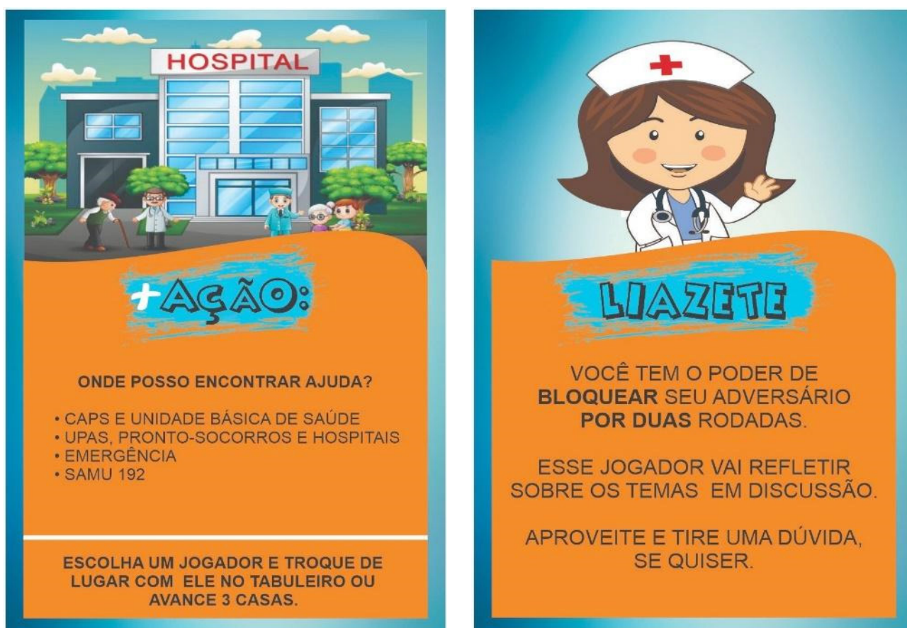
Figura 4 – Carta Especial (+Ação) do Jogo SuperAção. Sobral/Ceará-Brasil, 2021.

Os jogadores avançam as casas até o final do jogo, à medida que são respondidas corretamente às perguntas contidas nas cartas. Haverá, também, cartas especiais que auxiliarão, ou não auxiliarão a chegada mais rápida de cada jogador, conforme apresentado na figura 4. No Manual de Regras, é explicado como cada carta especial funciona.