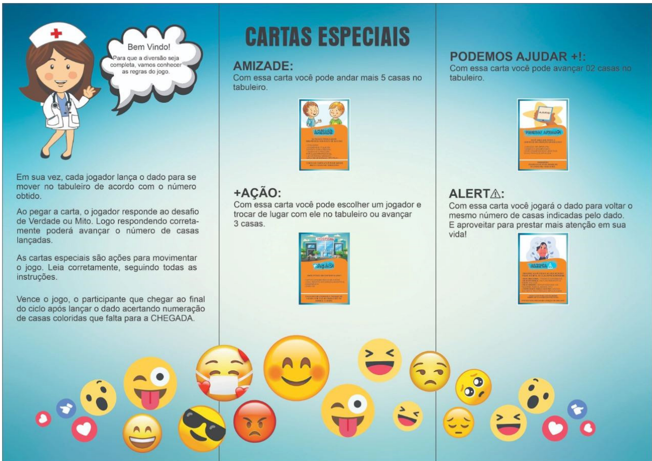
Figura 01 – Manual de Regras do Jogo SuperAção. Sobral/Ceará-Brasil, 2021.

elaborado pelos autores, para possibilitar um maior entendimento sobre o jogo e suas regras. A figura 01 apresenta esse manual elaborado.